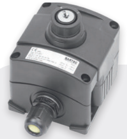
Interrupteur à clé TCS pour commuter le circuit de mesure du mode Capacité au mode Résistance

Le système de mise à la terre TERRACAP TCB040 détecte une liaison à faible impédance par l'intermédiaire des becs de la pince. En cas de détection d'une telle liaison, l'appareil neutralise efficacement les charges électrostatiques au moyen d'une résistance et empêche ainsi les décharges à étincelles. L'unité de commande contrôle ensuite la capacité mesurée par la pince. Si cette capacité est correcte pour le camion-citerne, un témoin vert s'allume et le relais de verrouillage autorise le chargement des substances. Par la suite, l'appareil établit une liaison à faible impédance à la terre et évite ainsi que de nouvelles charges électrostatiques n'apparaissent à nouveau. La liaison établie par l'intermédiaire des pinces est contrôlée en permanence pendant le transport des produits.