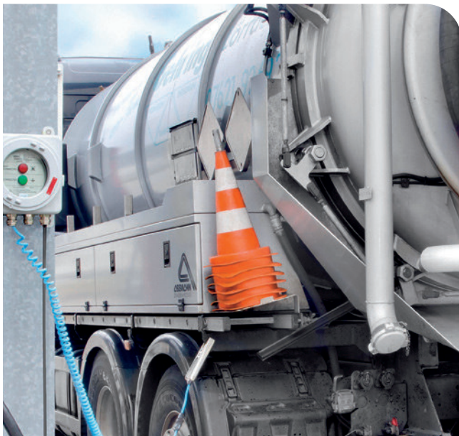
Mise à la terre active sur le camion-citerne